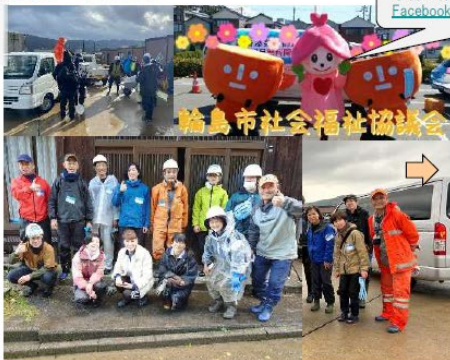
災害ボランティアセンター9:30到着 →全員オリエンテーションへ