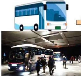
石川県庁前集合・受付 →大型バス6:45出発