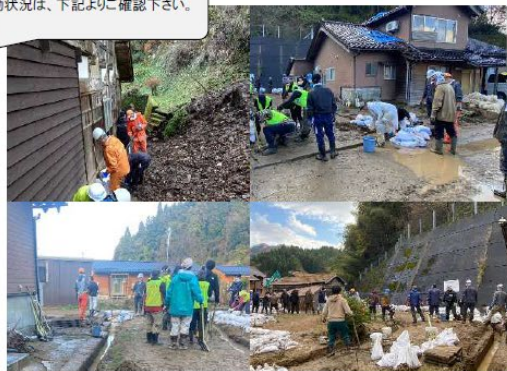
支援者と活動内容のマッチング →資機材を積んで現地へ出発・活動

豪雨災害被災地は、『公費による住宅解体』が始まったばかり。黒瓦屋根をブルーシート補修した住宅に住み続けていた。輪島市&七尾市はまだ手付かずの状況である。被災地の小学生を含む多くの子供たちは、年末を迎えるにあたり「アニバーサリー反応(節目反応)」が蘇り、新しい年が迎えらるのか不安を抱えている。お客さまの心に寄り添った広報活動等はいつでも始められる支援である。